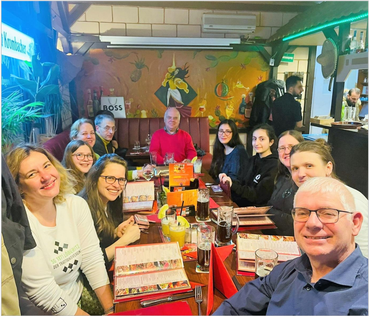
Aus der Perspektive des Kellners