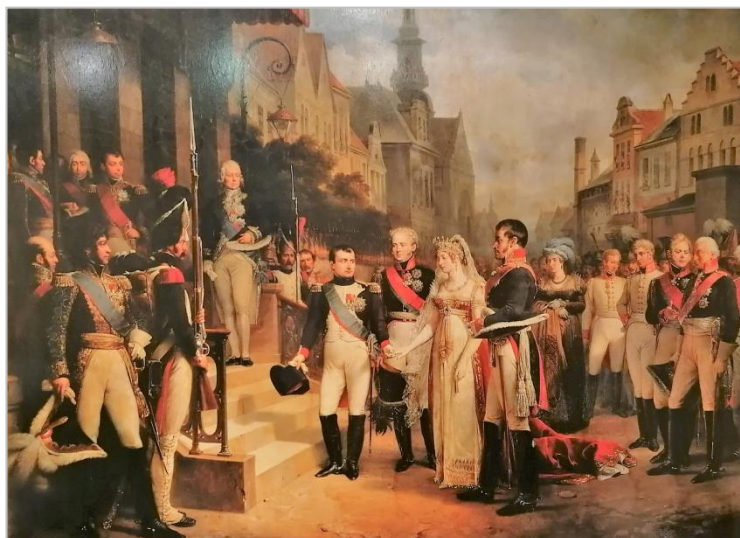
Alles unter den Augen von Napoleon Bonaparte