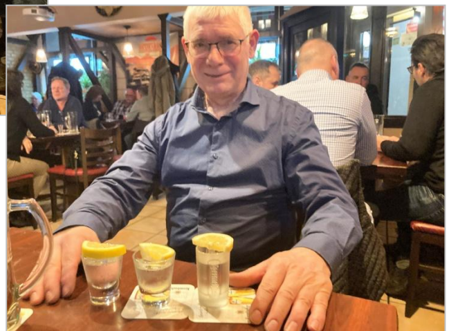
Die Mannschaft bedankt sich beim Chevaliere für die Hilfe mit Tequila